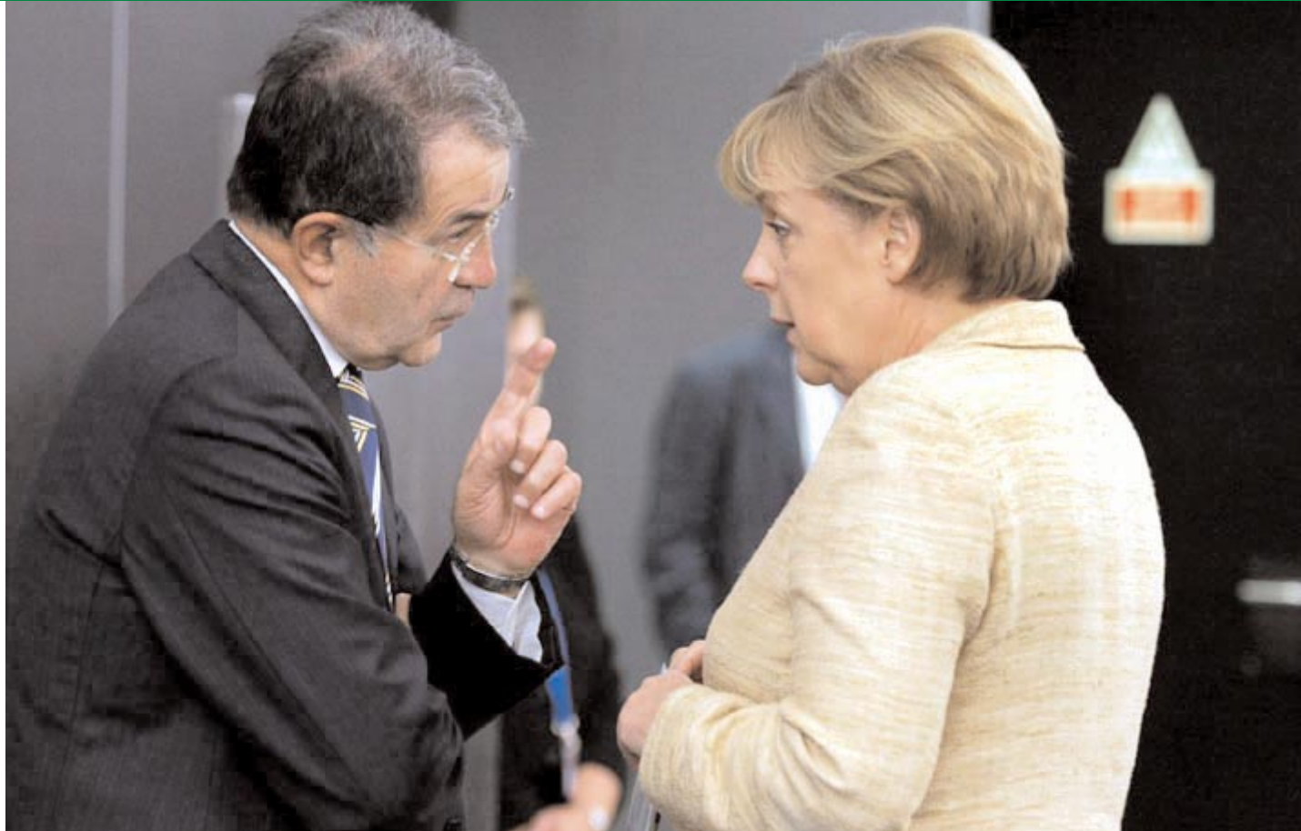
Kanzlerin Angela Merkel in heftiger Diskussion mit dem italienischen Ministerpräsidenten Romano Prodi