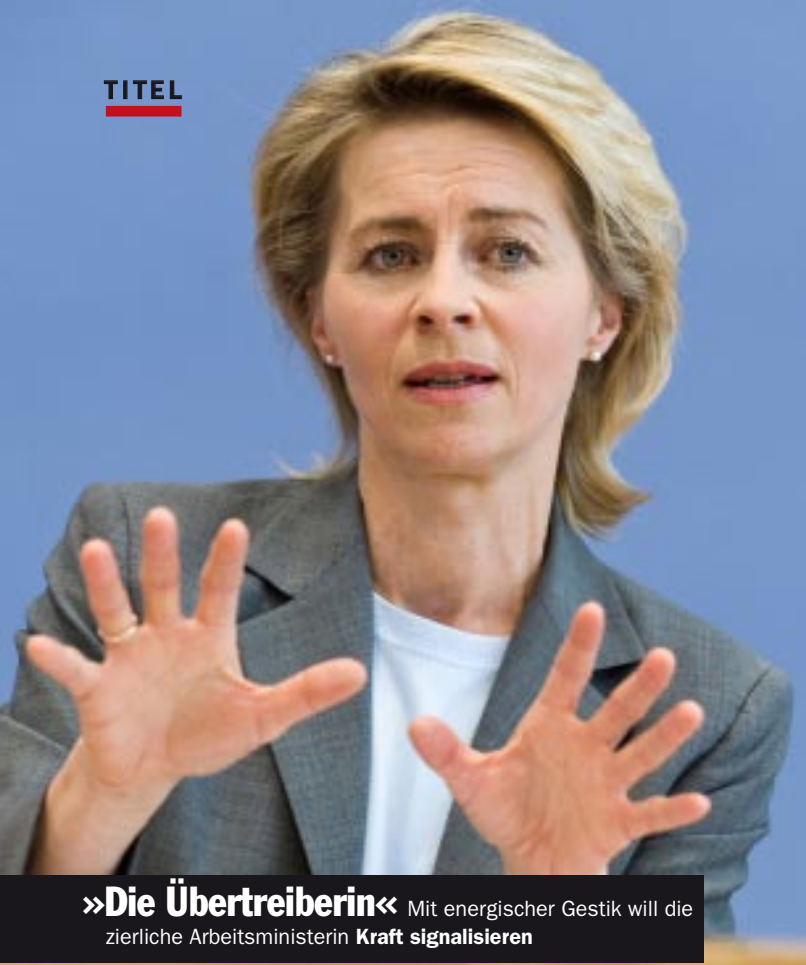
»Die Übertreiberin« Mit energischer Gestik will die zierliche Arbeitsministerin Kraft signalisieren