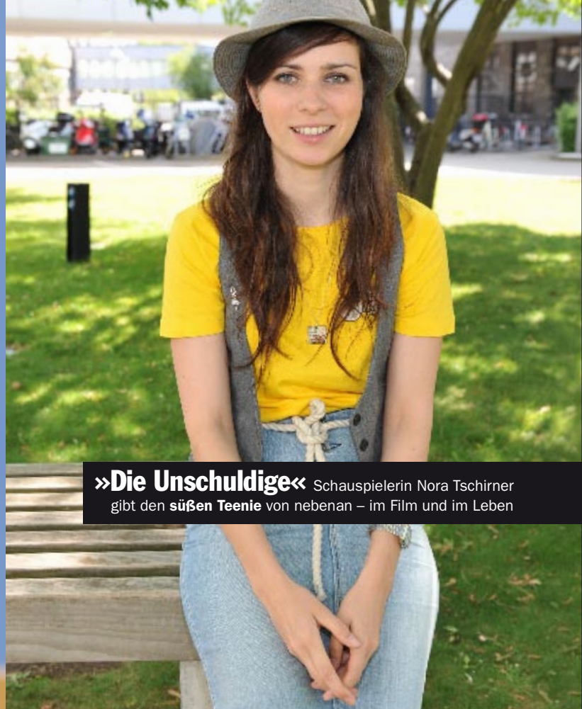
»Die Unschuldige« Schauspielerinnen Nora Tschirner gibt den süßen Teenie von nebenan – im Film und im Leben